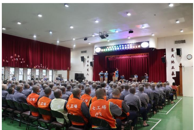
烏克蘭麗班詩歌表演，熱情歡迎嘉賓的到來。