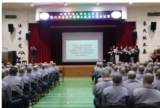
宣隊詩班演唱詩歌，歌曲讓受刑人感受力量與溫暖。