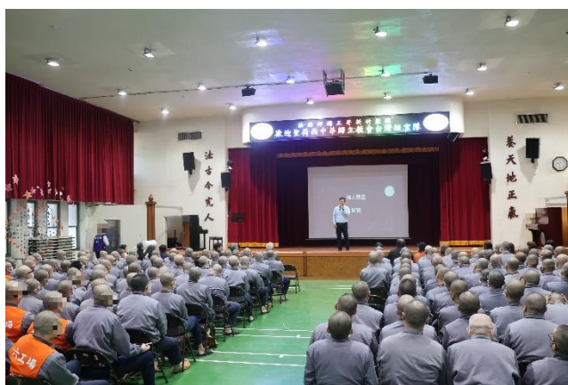
聖荷西中華歸主教會弟兄見證，認識上帝，並遠離被毒品荊棘困綁的身心。